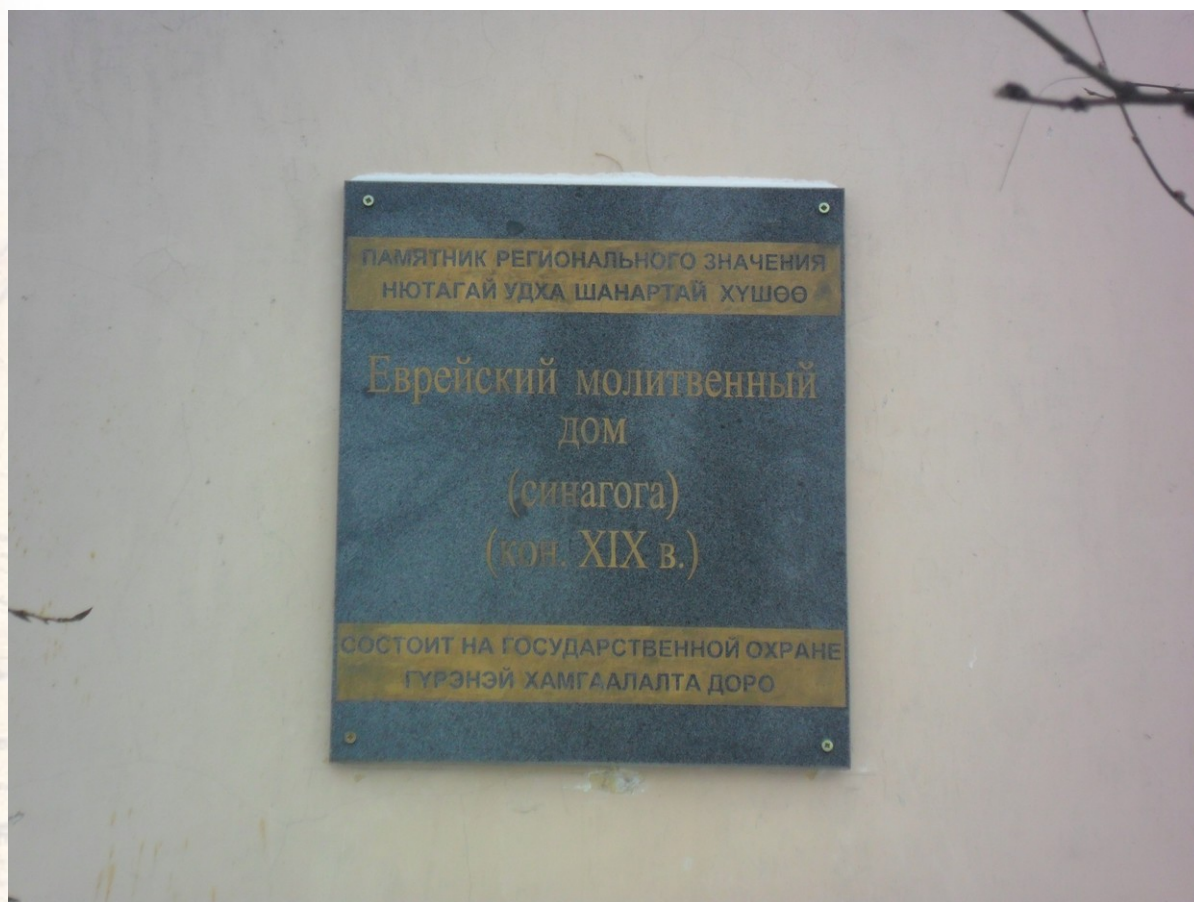
Фотографии 1, 2. Здание бывшей Верхнеудинской синагоги. Фотографии Л. В. Кальминой (г. Улан-Удэ).